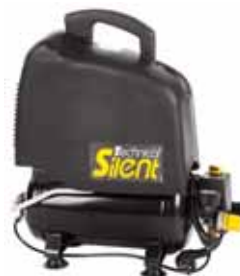
Vento Silent 66