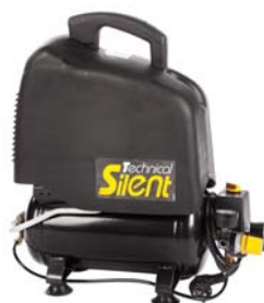
Vento Silent 66