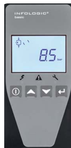
Infologic 2 Basic besturing